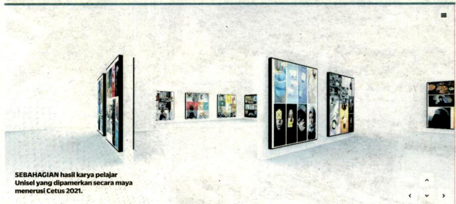
SEBAHAGIAN hasil karya pelajar Unisel yang dipamerkan secara maya menerusi Cetus 2021.

Menariknya, hasil idea dan kerja para pelajar tersebut bukan sahaja dipamer, malah dinilai dan pemenang akan diberi pingat emas, perak dan gangsa bagi