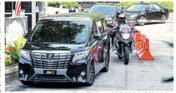
KENDERAAN membawa Tan Sri Muhyiddin Yassin dari rumahnya di Bukit Damansara menuju ke Publika di Jalan Dutamas, Kuala Lumpur bagi menghadiri Mesyuarat Parti Pribumi Bersatu Malaysia (Beratu) semalam.