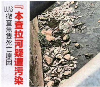
位于灵市14区的本查拉河日前出现鱼只大量死亡事件。

(八打灵再也15讯) 位于灵市14区的本查拉河 (Sungai Penchala) 日前出现大量鱼只死亡事故后, 雪州水务管理机构 (LUAS) 等单位已着手进行调查, 以确认事故原因。