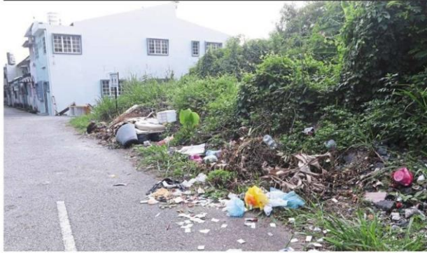
Residents say outsiders can easily drive into the area to dump rubbish. They are proposing that the road be closed to deter them.