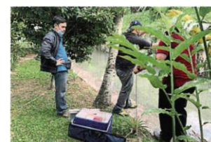
雪州水务管理机构在位于灵市14区的本查拉河一带展开调查, 以确认鱼只死亡的原因。