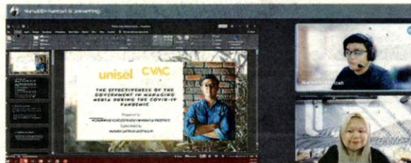
SEORANG pelajar membentangkan hasil inovasinya secara online untuk dinilai oleh juri.