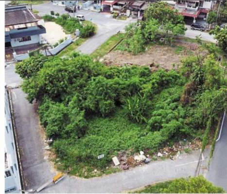
An aerial view of the illegal dumpsite off Jalan Mastika in Taman Setia, Klang.